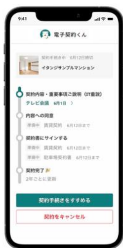
「電子契約くん」入居者利用画面イメージ

イタンジの不動産賃貸業務のDXサービス群「ITANDI BB+（イタンジビービープラス）」の不動産関連電子契約システム「電子契約くん（ https://lp.itandibb.com/denshi-keiyaku/ ）」は、不動産の賃貸借契約や更新契約、駐車場契約をオンラインで完結できるシステムです。